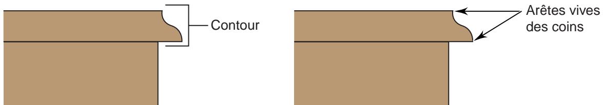
Figure 5.2.2 Distinction entre le contour et un coin

5. Lorsque le ponçage est terminé, retirer la machine de la surface avant de l'arrêter.