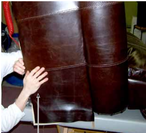
Figure 2.6.1 Technique de fixation