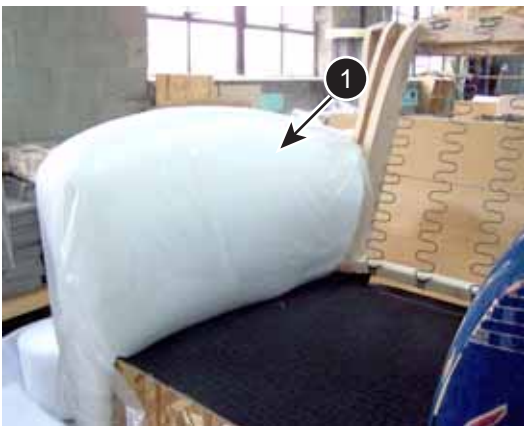
Figure 2.6.5 Garnissage par section – Accoudoirs

Les exemples des figures 2.6.5 et 2.6.6 représentent le processus de garnissage par section tantôt sur des accoudoirs, tantôt sur un dossier.