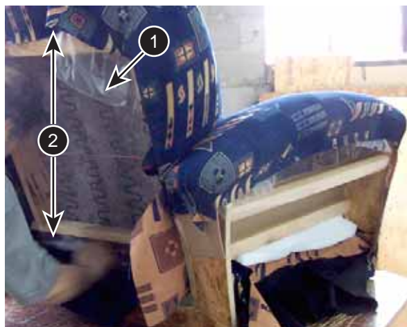
Figure 2.6.6 Garnissage par section – Dossier

Il est à noter que les accoudoirs sont parfois indépendants du bâti. Ils sont fixés lors de la finition du meuble.