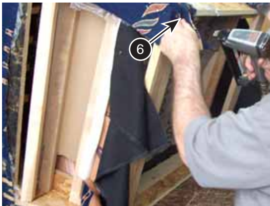
Figure 2.6.5 Garnissage par section – Accoudoirs (suite)

6. Tendre le matériau et l'agrafer sous le bâti.