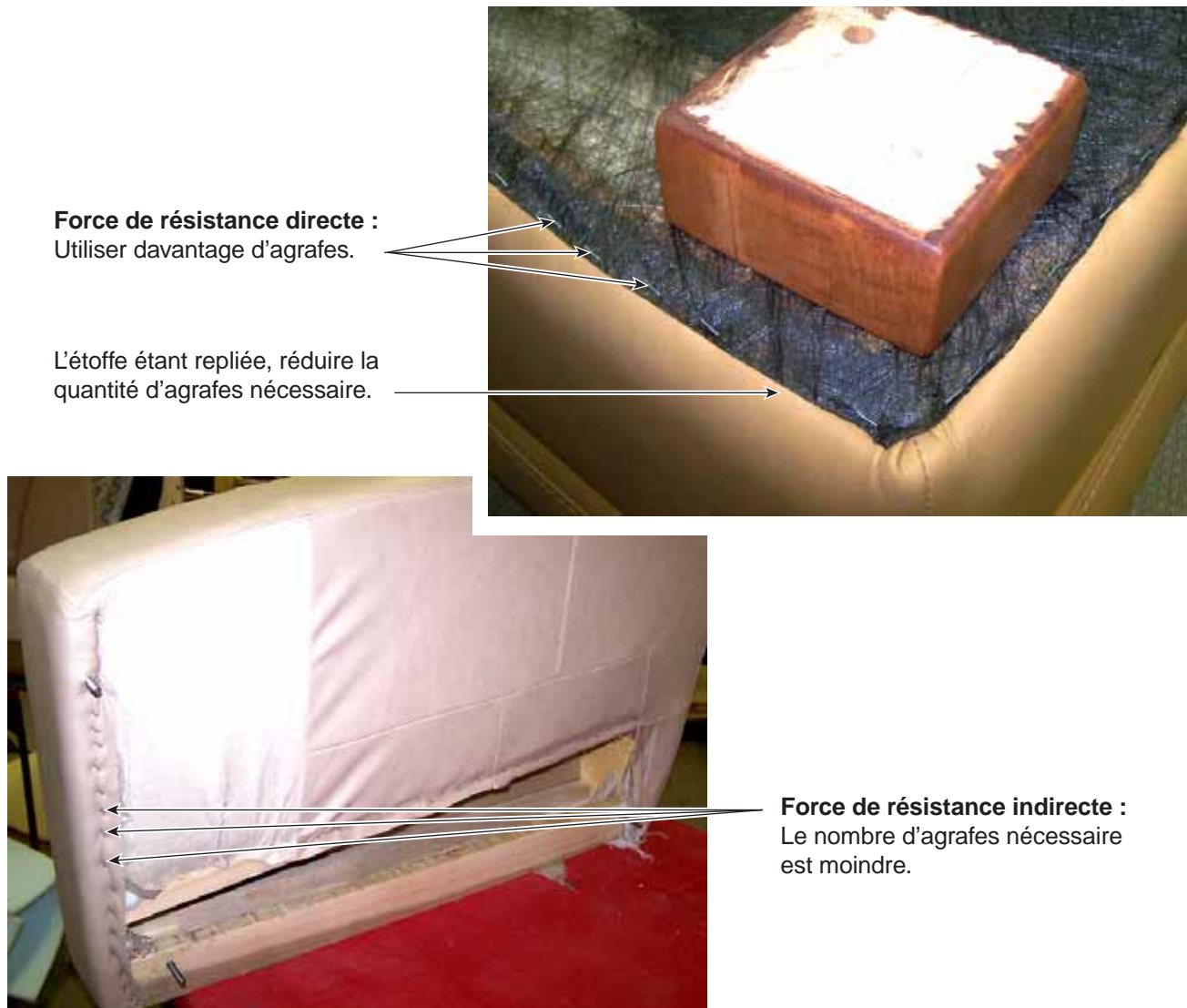
Figure 2.6.3 Force de résistance

Le nombre d'agrafes utilisé dépend de la force de résistance du matériau de recouvrement. Si ce dernier est agrafé sous la traverse d'un siège, la force de résistance est indirecte. On utilise alors un minimum d'agrafes. Par contre, si l'on agrafe l'étoffe à l'avant de la traverse, la force est directe. Dans ce cas, il est justifié d'utiliser davantage d'agrafes (figure 2.6.3).